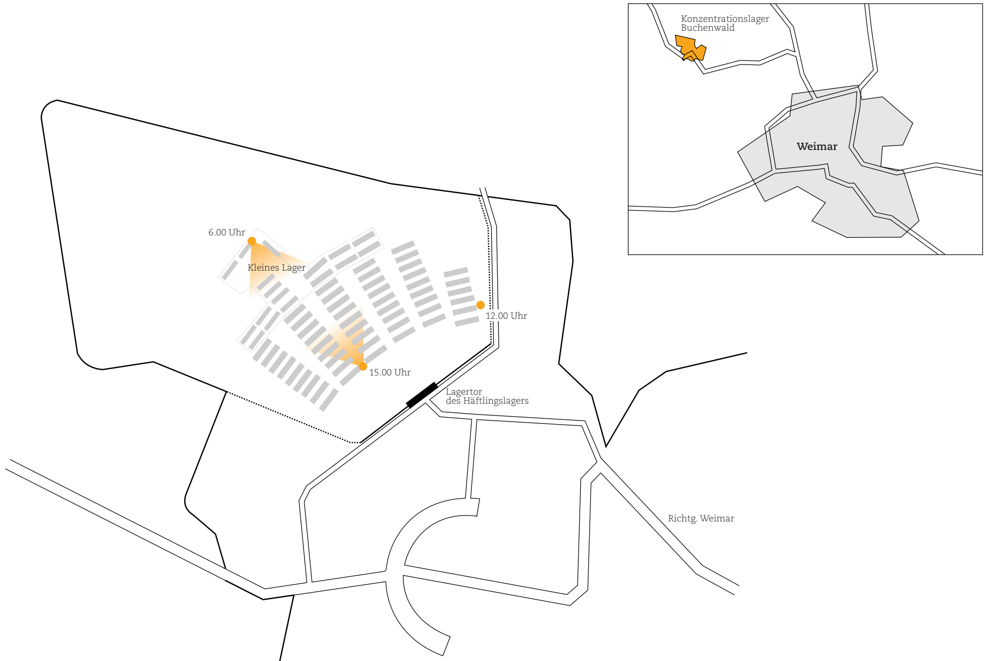
Abb. 2 | Lageplan des Konzentrationslagers Buchenwald mit auszugswiser Darstellung des Häftlingslagers, des Kleinen Lagers, den Dokumentationsstandpunkten und deren Blickwinkeln.