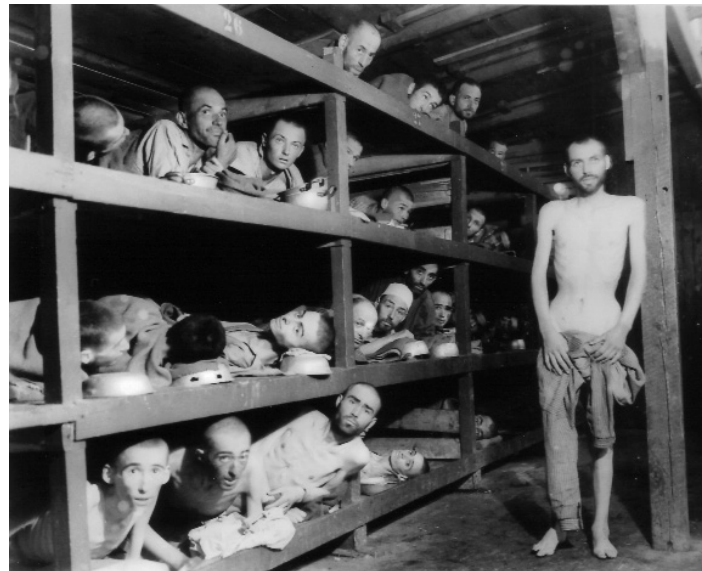
Abb. 9 | »Kleines Lager«, 1945.

So sehe und sah ich meine Aufgabe darin, das Fundament für einen Dialog zu legen, damit die Erinnerung wach bleibt.