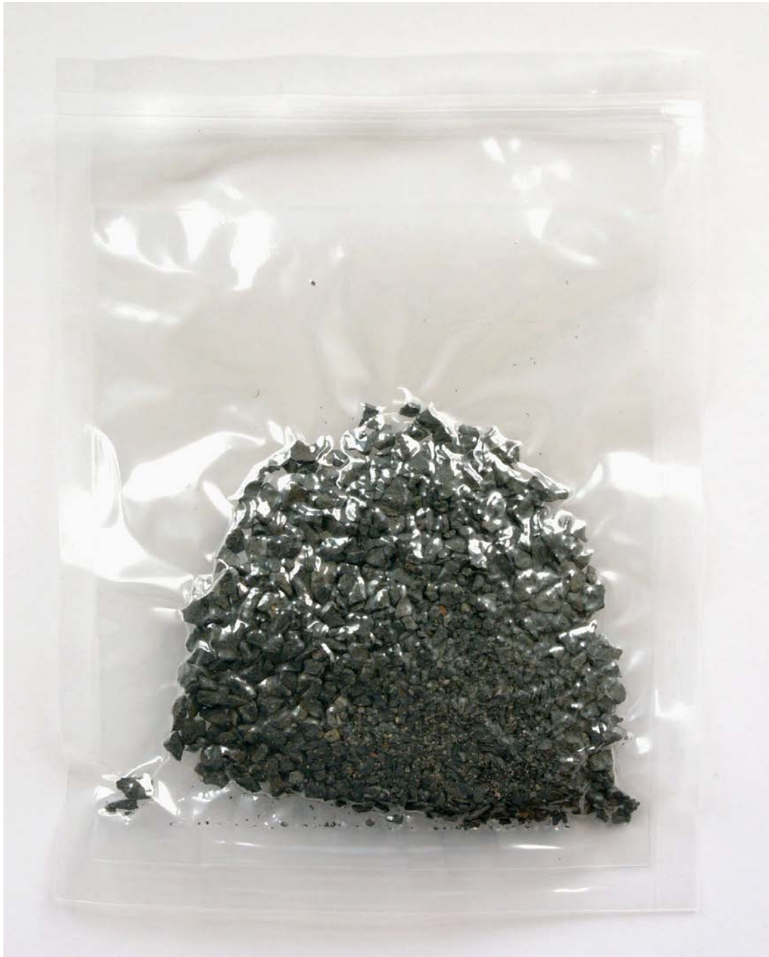
Abb. 11 | Kies, vacuumiert.