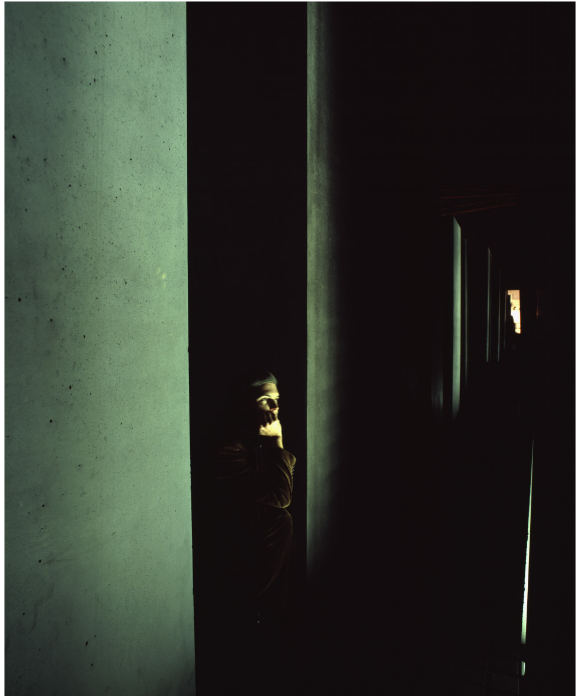
Abb. 1 | Warten.