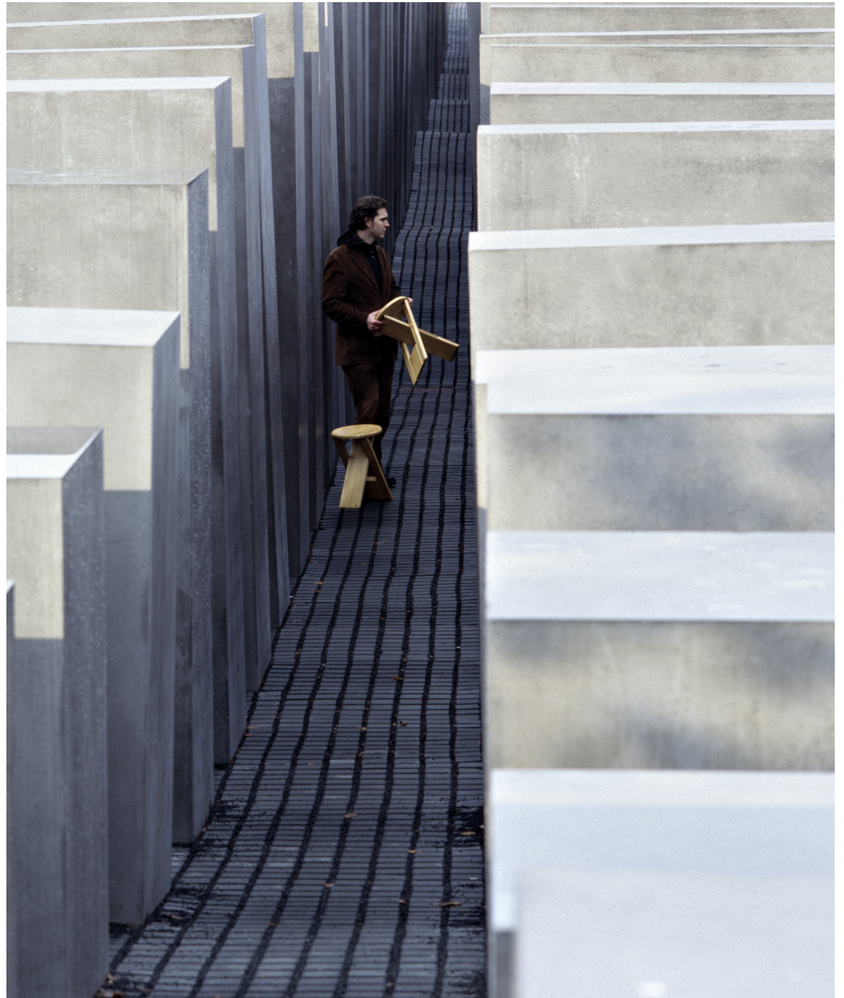
Abb. 12 | Vorbereitung.