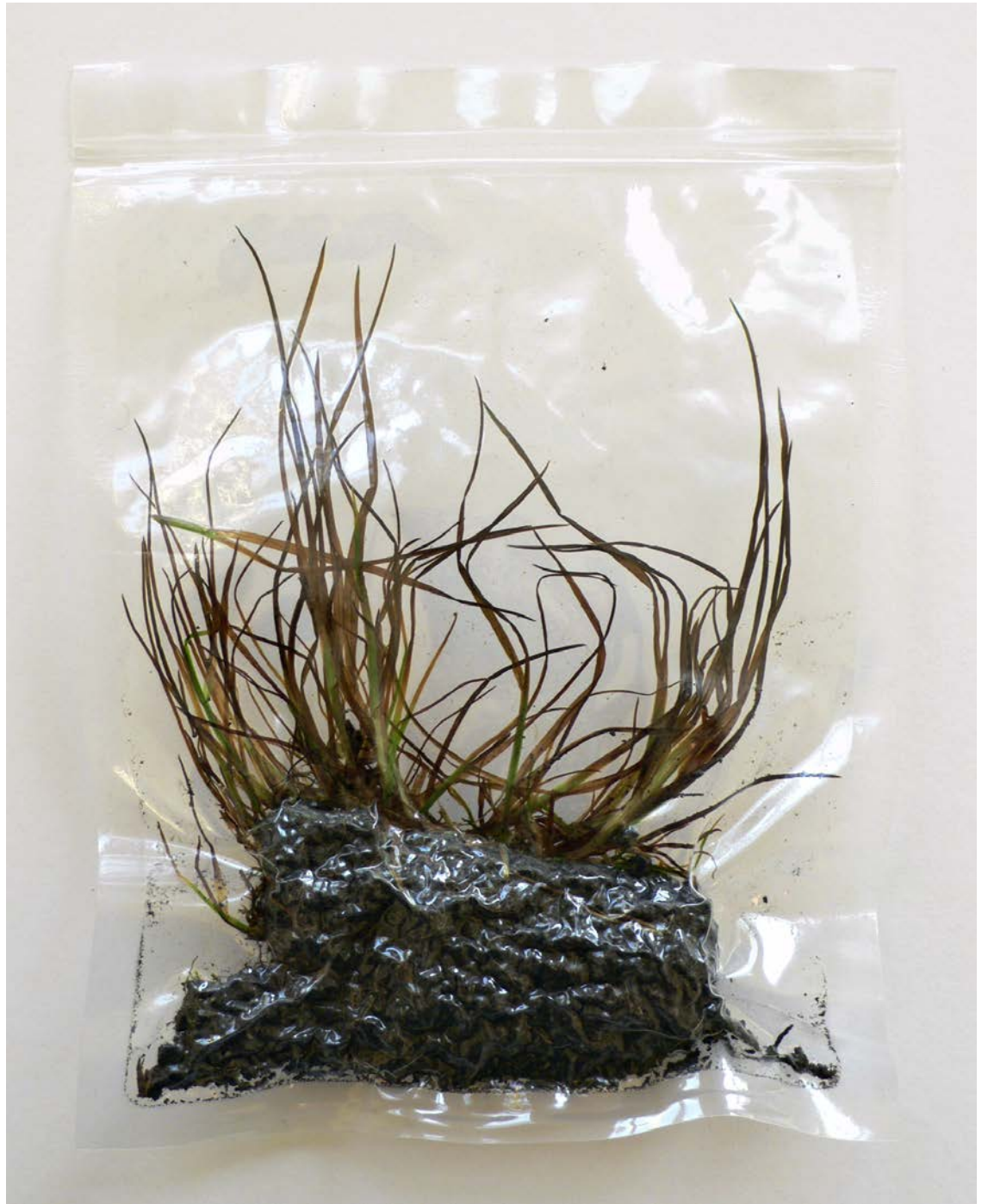
Abb. 10 | Erde aus dem »Kleinen Lager«, vacuumiert.